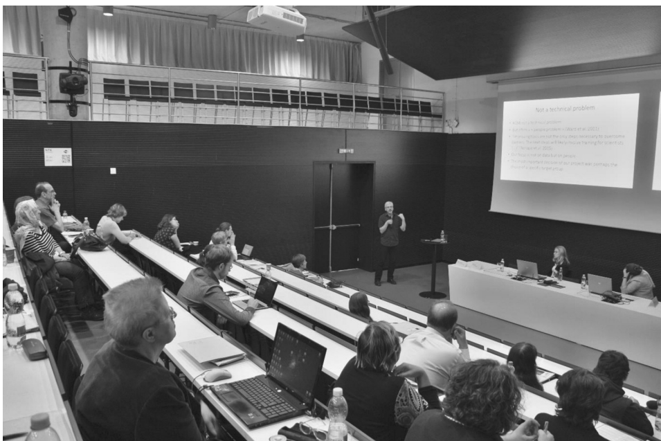
Obr. 3 Konference o šedé literatuře a repozitářích, 2017

Zatím poslední desátá, a tedy jubilejní konference, proběhla v říjnu 2017. Velká pozornost byla na tomto ročníku konference věnována výzkumným datům a práci s nimi, soustředily se na ně hned tři příspěvky, jak bylo již zmíněno. Oblíbenou stálíci v programu konference jsou prezentace právníků týkající se autorského práva, provozu digitálních repozitářů, osobních údajů nebo veřejných licencí. Přednášející se samozřejmě vrací i ke klasické šedé literatuře, zejména vysokoškolským kvalifikačním pracím a výzkumným publikacím. Konference se zúčastnili hosté z Rakouska, Francie, Slovenska a zcela poprvé přijeli účastníci z Alžíru. Den před konferencí proběhl navíc workshop Výzkumná data a dizertace věnovaný základním otázkám managementu výzkumných dat a možnostem vzdělávání ohledně výzkumných dat pro výzkumníky a studenty na akademické půdě.